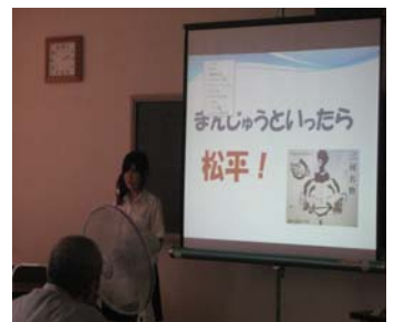
ふるさと本舗様をお招きして、プレゼンテーションをする生徒達

今後、11月3日（祝）キッズビジネスタウンあいち かりや会場、来年の全国大会でも販売予定です。（刈谷市産業振興センター）