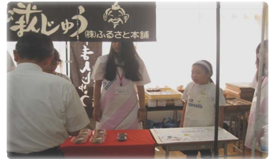
キッズビジネスタウンあいち なかがわ会場の様子