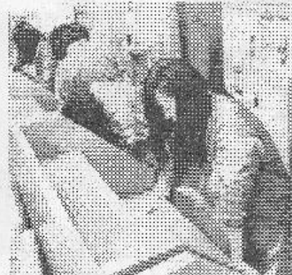
▲学習机もピカピカに

11月22日(木)松平高校の2年生38名が来館し、窓ふきや外のゴミ拾い等、普段気づかない汚れた場所を見つけ清掃活動を行いました。きれいになった館で気持ち良い新年を迎えることが出来ました。