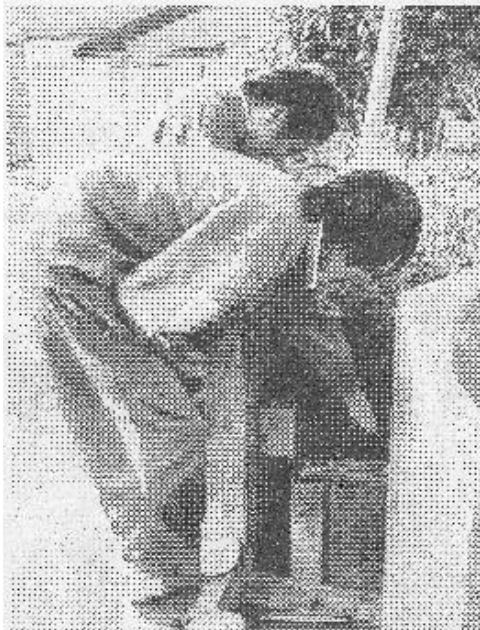
▲植え込みのゴミもなく なりすっきりしました。